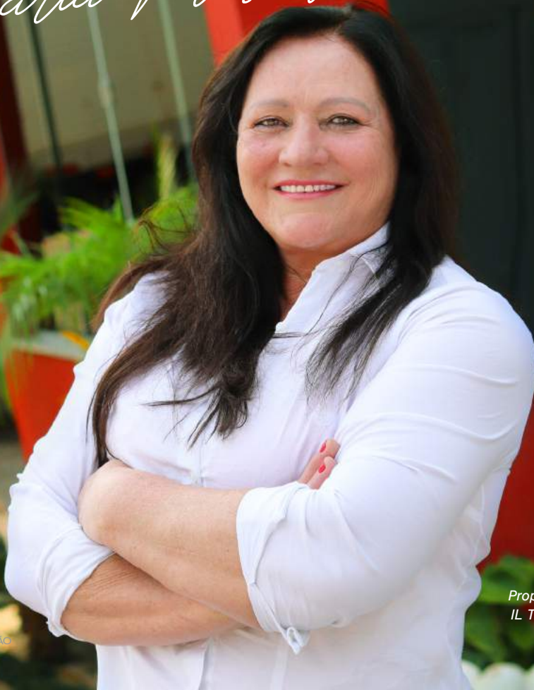
Proprietária da IL Transportes